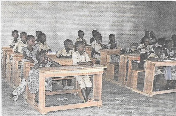
Grâce à leur nouvelle classe, les écoliers peuvent travailler dans de meilleures conditions.

Les travaux de création d'une troisième salle de classe et du bureau de la directrice à l'école primaire n° 3 ont débuté dans le courant de l'année et se sont terminés pour la rentrée des classes, quelques finitions restant à réaliser. La totalité des travaux s'élevait à 7 500 €, financés par le village et les aides de la région Grand Est et du Comité de coopération. Cette extension était rendue