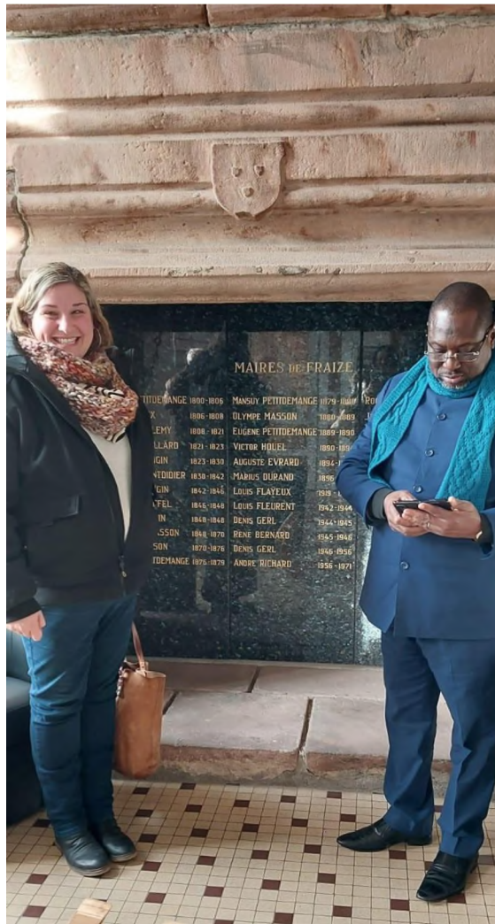
Dans le hall de la mairie