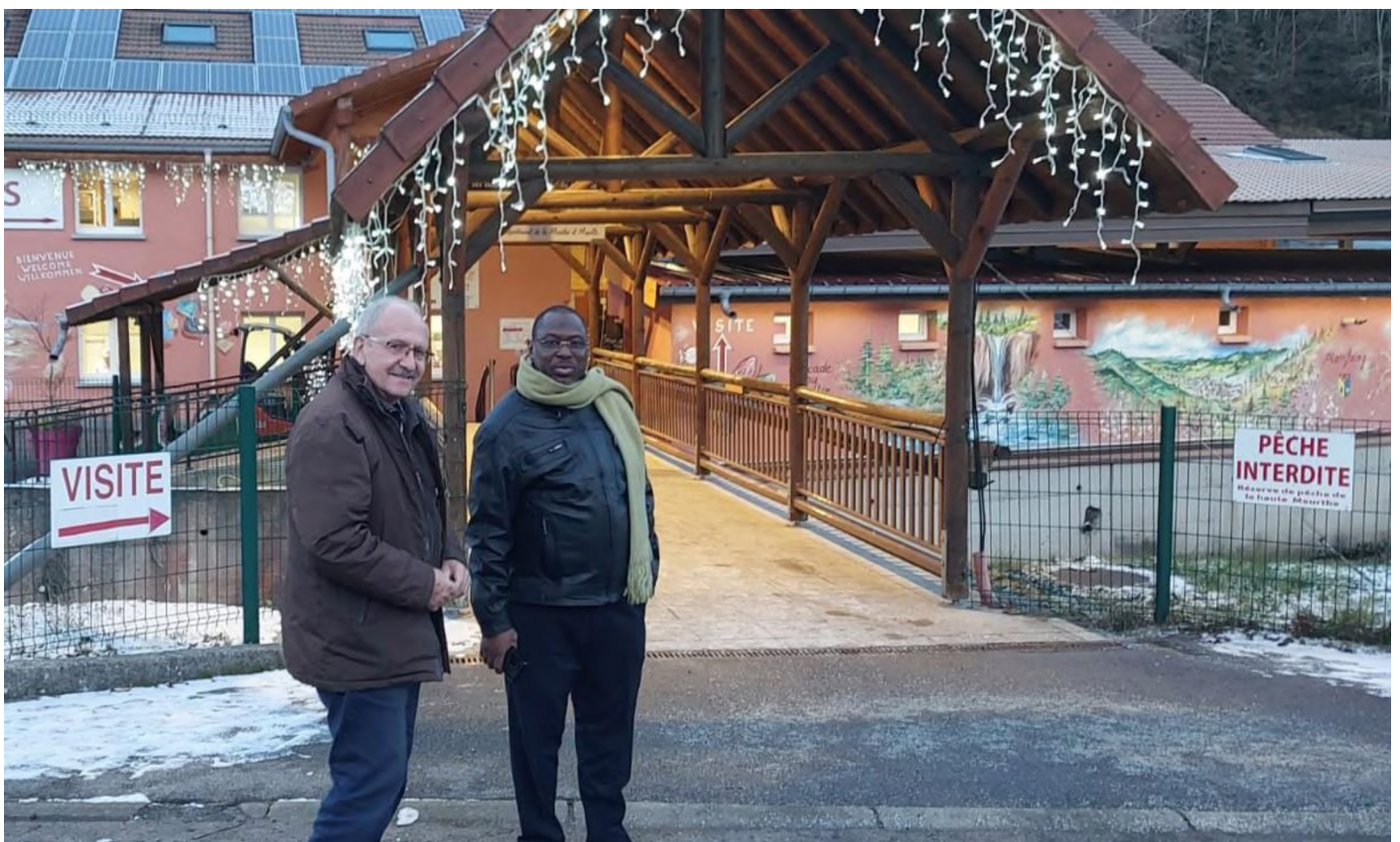
Visite de la CDHV (Confiserie des Hautes Vosges)