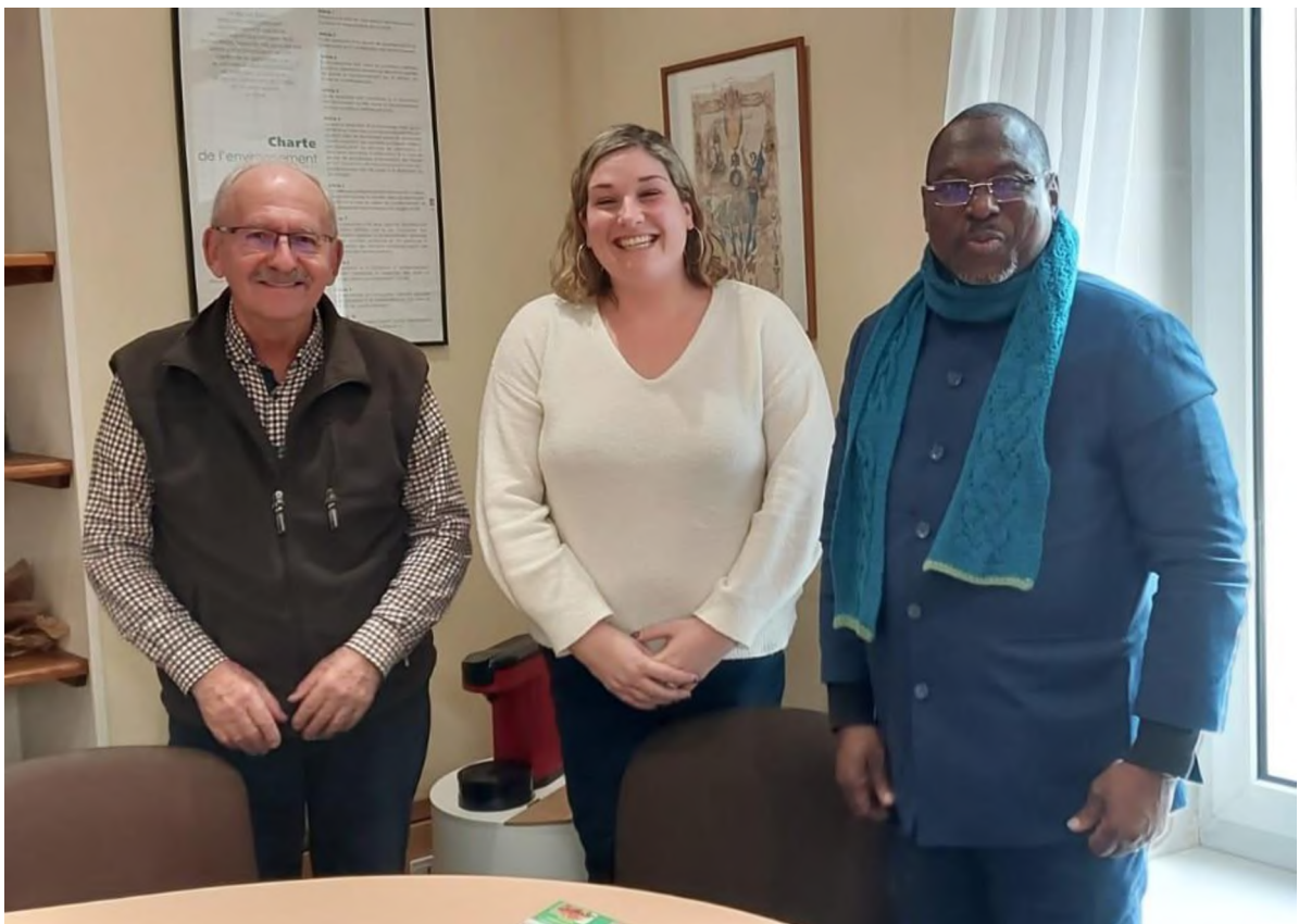
Accueil dans le bureau de Mme la Maire