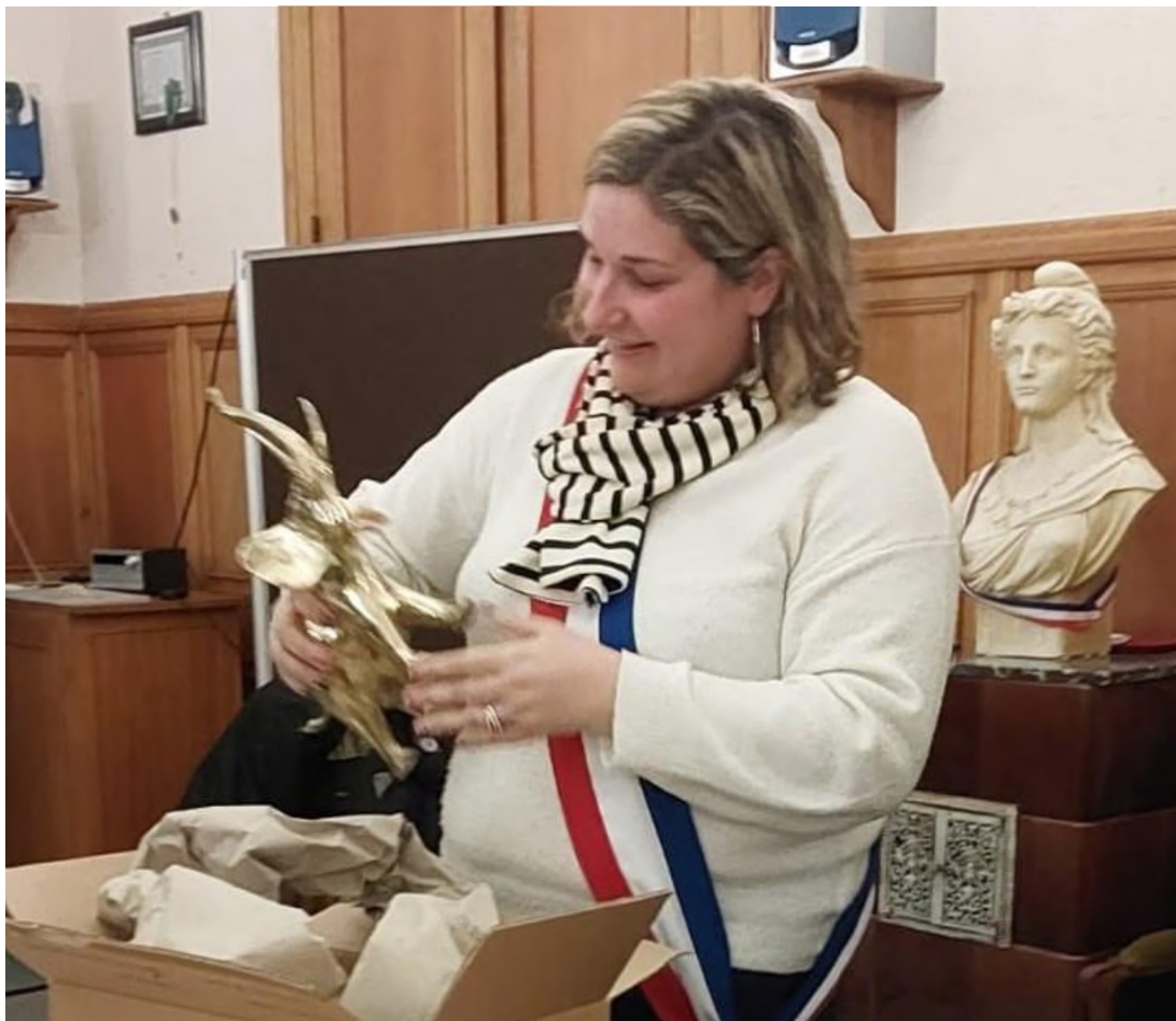
L'éléphant ivoirien !