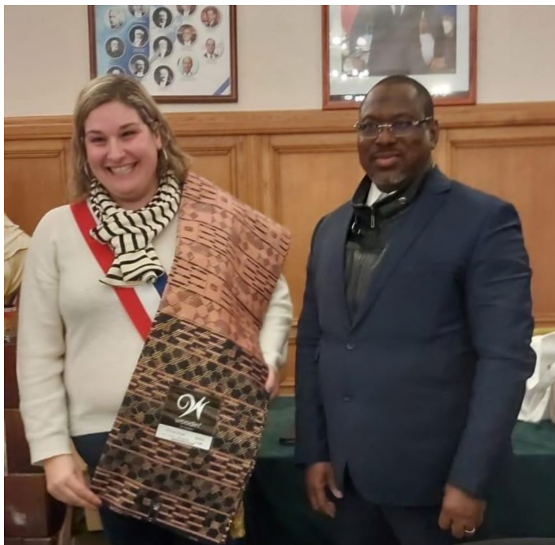
Cadeau de Mr le Maire à Mme la Maire