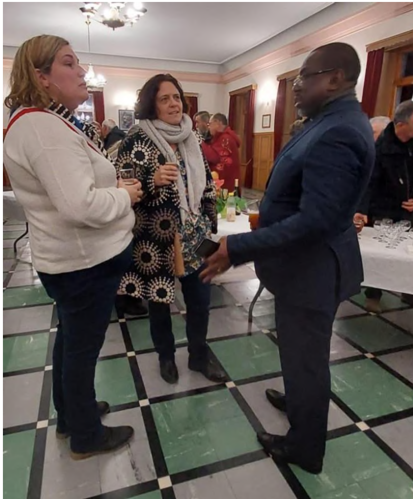
On parle projets d'avenir