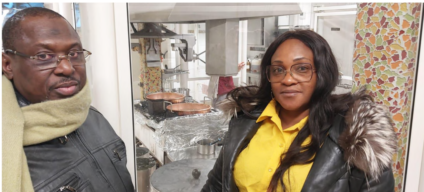
A la fabrique de bonbons