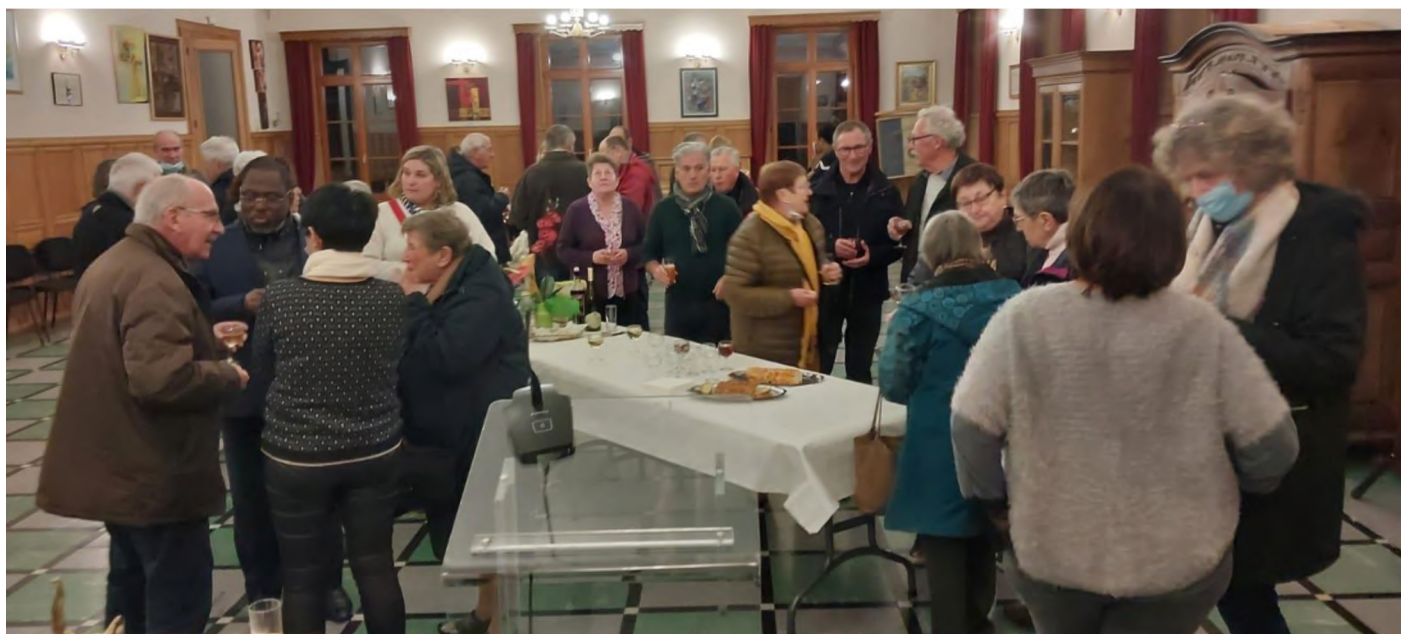
Membres partenaires, élus, amis ....