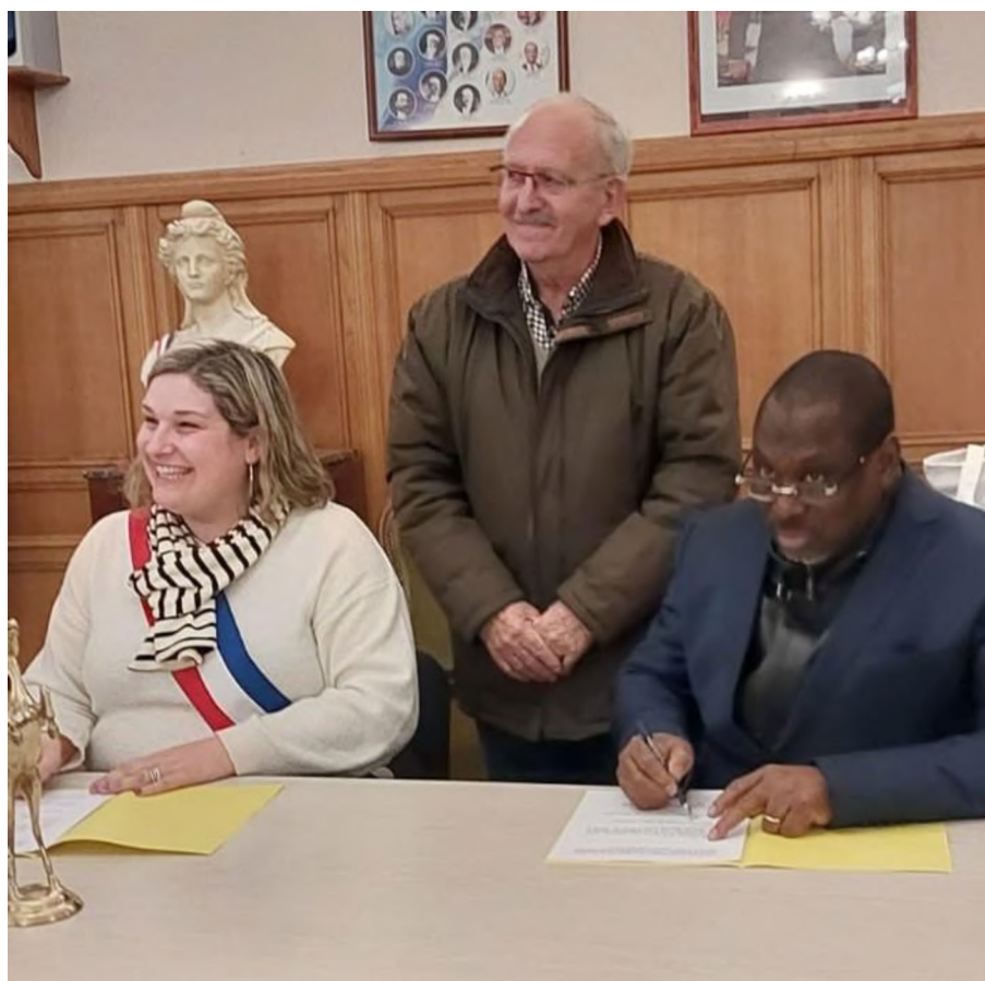
Signature de la convention